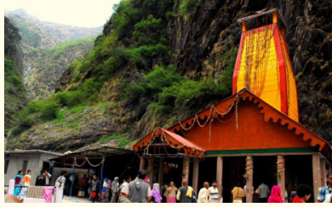
అన్ని చర్చలు తీసుకుంటుంది. తీర్మాతలకు సలహానిచ్చి ప్రాంతీక సన్మానల సమకూర్చు పూర్తి చేశారు. లోయ మరపుతుంది, తాగునీటి నిర్మాణం, యాత్రకుల సమాచారం కోసం ఒక డిజిటల్ సిస్టం చేస్తున్నారు. ఛార్ ధామ్ వచ్చే భక్తులకు తగినట్లుగా ఏర్పాటు చేస్తున్నారు. ఇప్పటికే ప్రభుత్వం కేరళ నిర్ణయం తీసుకుంది. ఛార్ ధామ్ అయోజనం మొత్తం నిషేధిస్తున్న ప్రభుత్వం ఇప్పటికే నిర్ణయం తీసుకుంది.

అంతేకాక, స్థానిక హోటల్ యజమానులు, టాక్సీ డ్రైవర్లు, వ్యాపారవేత్తలకు మంచి లాభాలను తీసుకురానుంది. ఈ అదనపు సమయం వర్షాల్పక వ్యాపారాన్ని గణనీయంగా పెంచుతుంది స్థానికంగా వెలుగుతుంది. ఛార్ ధామ్ యాత్ర ప్రారంభానికి అక్షయ తృతీయ ఒక ప్రత్యేక రోజుగా పరిగణించబడుతుంది. హిందూ సంవత్సరం ప్రకారం, అక్షయ తృతీయ వైశాఖ మాసంలోని ప్రకాశవంతమైన వక్షంతో మూడవ రోజున వస్తుంది. 'అక్షయ' అంటే ఎప్పుడీ క్షీణించదని అర్థం. గ్రహాల ప్రకారం.. ఈ రోజున చేసే దానధర్మాలు, జపాలు, పుణ్యకార్యాల శాశ్వత ఫలాలను ఇచ్చాయి. ఈ రోజు సభ్య యుగం, శ్రేణి యుగాల ప్రారంభంగా పరిగణించబడుతుంది. ఈ రోజు అర్చనా ధామ్, గంగోత్రి-యమునోత్రి ద్వారా తెరవడం అక్షయం అనేకమైనదిగా పరిగణిస్తారు. ఎందుకంటే అది కొత్త ప్రారంభాలు, శ్రమలను సూచిస్తుంది. గత ఎదురైన ప్రతికూల పరిస్థితులు.. 2025 తీర్మాతల అనే ప్రతికూల పరిస్థితులు రోలు చేసుకున్నాయి. సరిహద్దు ఉత్పత్తల, తరచురూ ధరాలోకి ప్రత్యక్షమైతే పుణ్యక్షేత్రాల యాత్రకులకు అలంకారం కలిగింది. భగవంతుని దృష్టిపై సరిపాటు అనేకమైన తీర్మాతలను నిలిపివేయవలసి వచ్చింది. ఈ అనుకూల దృష్టి, ఉపసారి పరిపాలనలు యంత్రాంగం ఇప్పటికే అన్ని విధాలా అనుకూలంగా ఉంది. ప్రస్తుతం.. వాటిపై నిర్ణయం.. ఛార్ ధామ్ యాత్రకులకు ఏలాంటి అప్రయోజనం కలిగించడా ప్రభుత్వం