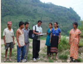
ఈ భూవాత్రవ కార్యాచరణ నిర్వహించడానికి భారత రిజిస్ట్రార్ జనరల్ కఠిన నిలబడనలను రూపొందించారు.

దేశవ్యాప్తంగా ఎన్నికలపూర్వకంగా అని ఎదురుచూస్తున్న జనాభా లెక్కల ప్రక్రియకు కేంద్ర ప్రభుత్వం గ్రీన్ సిగ్నల్ ఇచ్చింది. ఈ మేరకు జనాభా లెక్కల నోటిఫికేషన్ విడుదల చేస్తూ, మొదటి దశలో ఇండ గణన కోసం అడిగే 33 ప్రశ్నల జాబితాను వెల్లడించింది. డిజిటల్ పద్ధతిలో జరగనున్న ఈ భారీ ప్రక్రియ కోసం యంత్రాంగం ఇప్పటికే సిద్ధమైంది. తొలి దశలో మిగిలిన పనిని, కుటుంబ గణన వివరాలు, వనశులపై దృష్టి సారించవచ్చు.